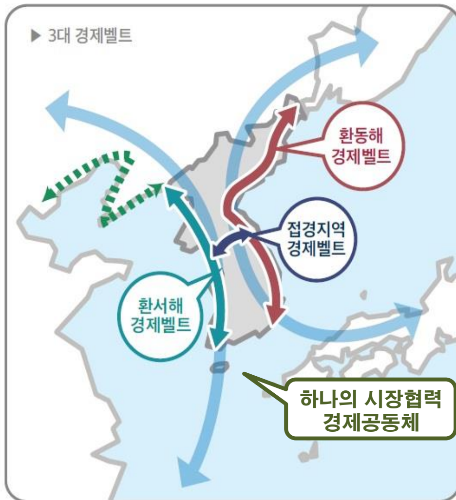
▶ 3대 경제벨트